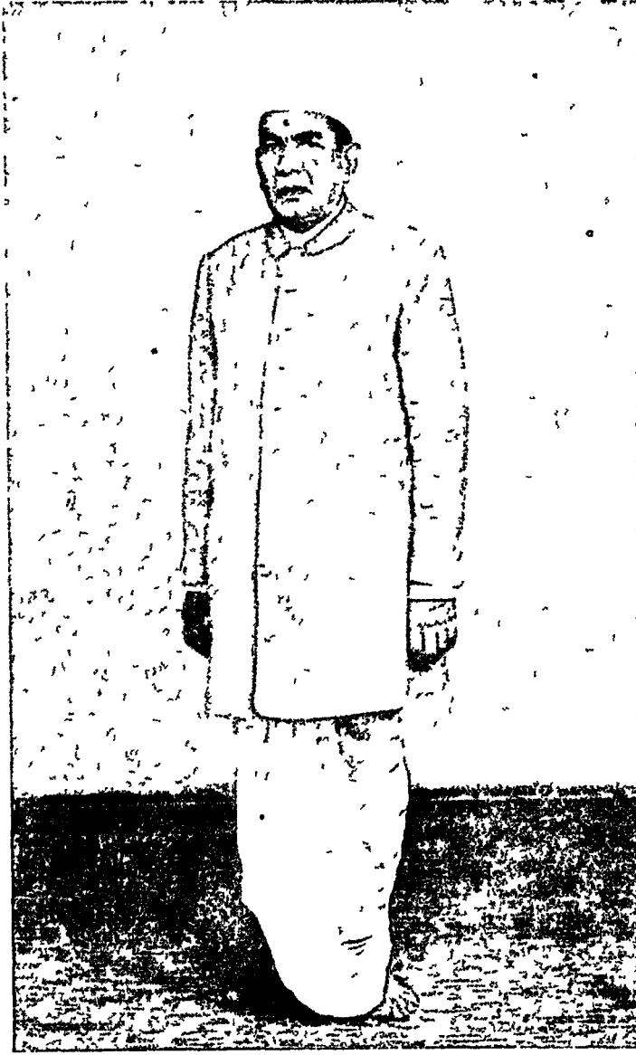
श्रेष्ठिवर्य धर्मपरायण रावणदाहर संघवी जगतदास प्रतापसिंह ने पी.